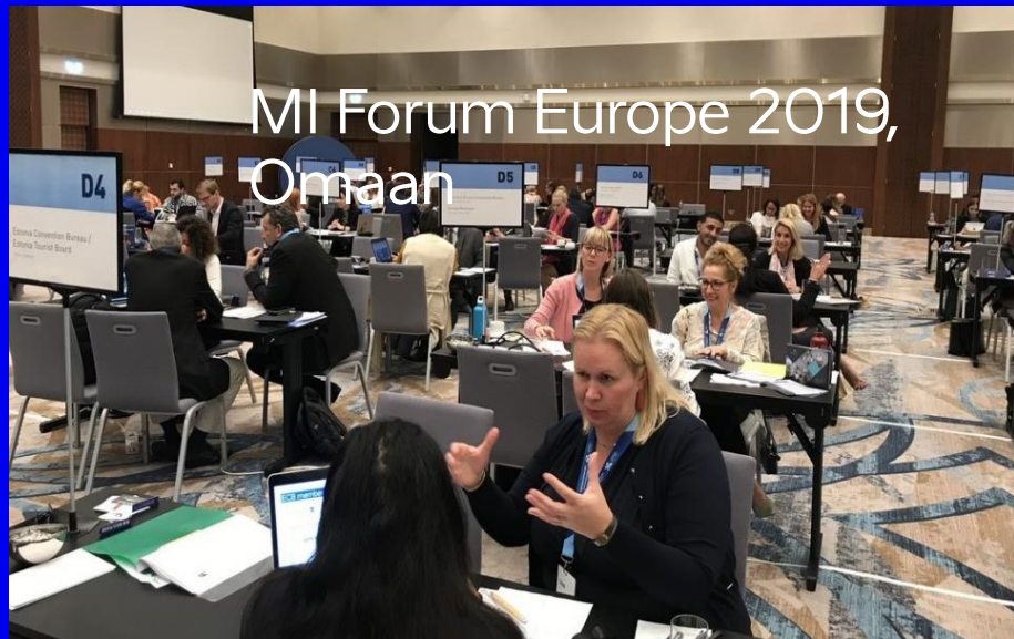
MI Forum Europe 2019, Omaan