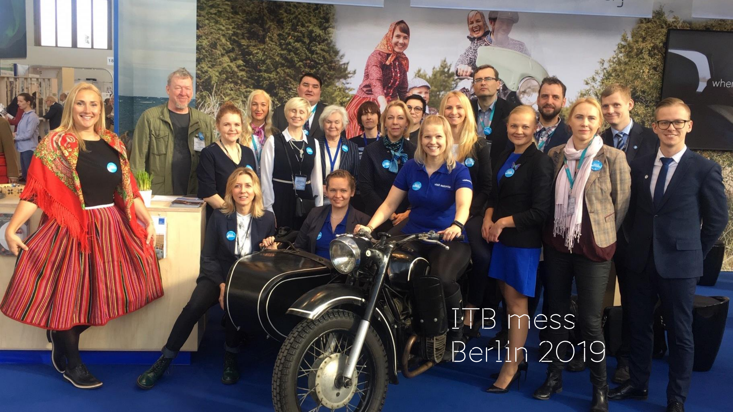
ITB mess Berlin 2019