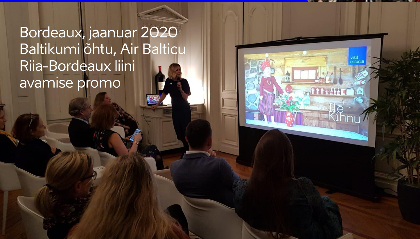
Bordeaux, jaanuar 2020 Baltikumi õhtu, Air Balticu Rii-Bordeaux liini avamise promo