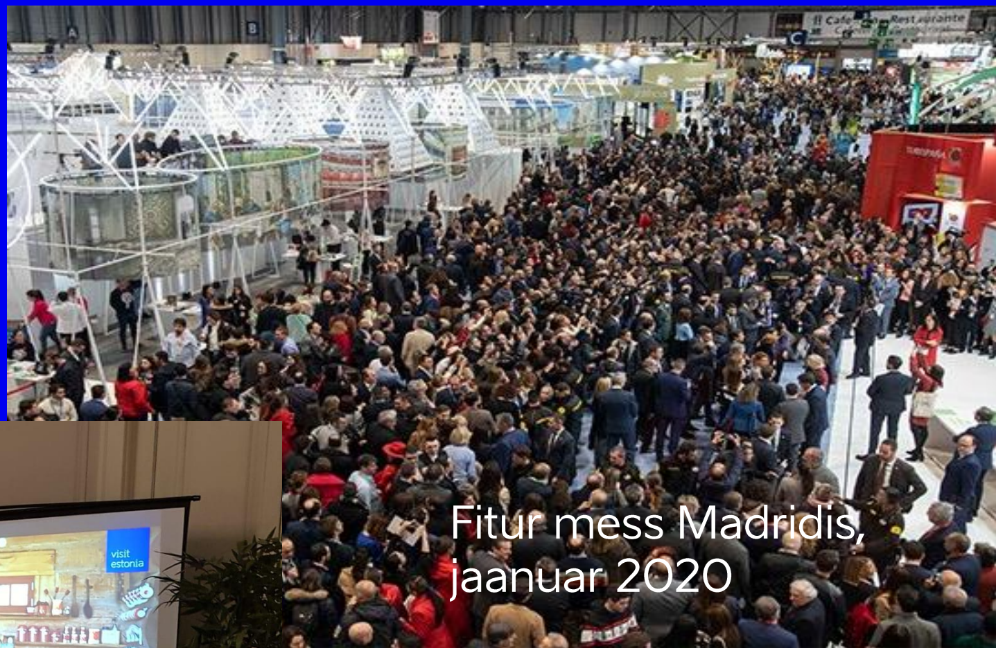
Fitur mess Madridis, jaanuar 2020