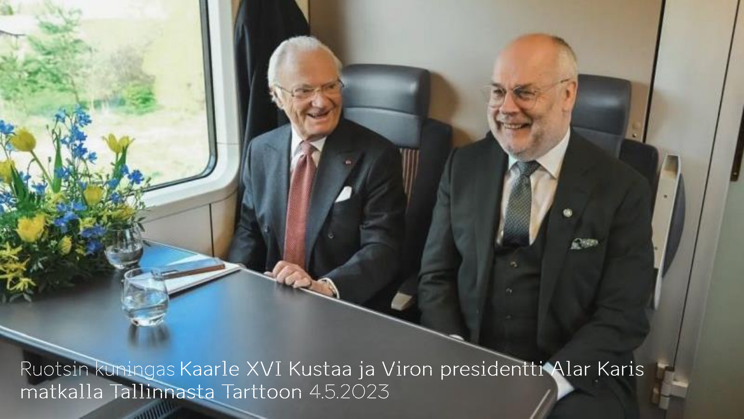
Ruotsin kuningas Kaarle XVI Kustaa ja Viron presidentti Alar Karis matkalla Tallinnasta Tarttoon 4.5.2023