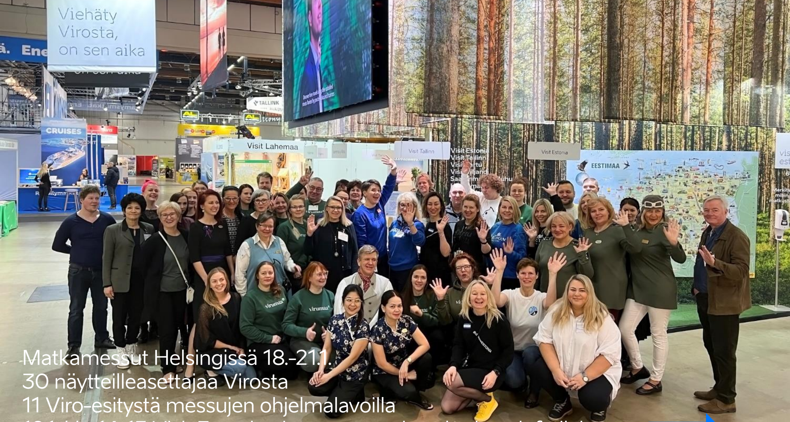
Matkamessut Helsingissä 18.-21.1. 30 näytteilleasettajaa Virosta 11 Viro-esitystä messujen ohjelmalavoilla 18.1. klo 14-15 Visit Estonian ja varustamojen yhteinen infotilaisuus